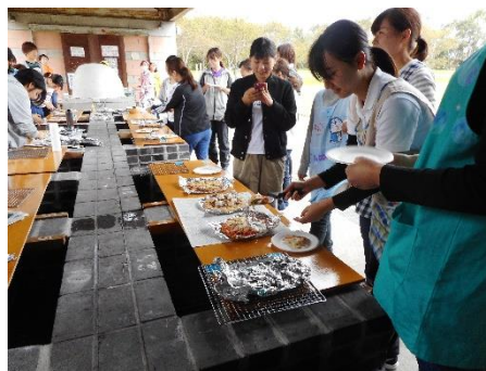
新任保育者フォローアップセミナー びわ湖こどもの国でゲームやピザづくり