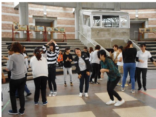
フォローアップセミナーの様子

平成25年度より、滋賀県保育士・保育所支援センターとして、保育人材無料職業紹介とともに、就職フェア、就業継続支援のため保育現場で働く先生たちのサポートもしています。園で働く皆さんの応援団です。今年度の事業の様子をお伝えします。